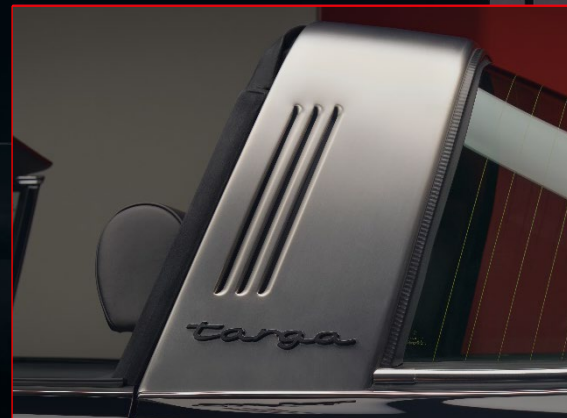
Targa Bügel lasiert in Platinum (seidenglanz)