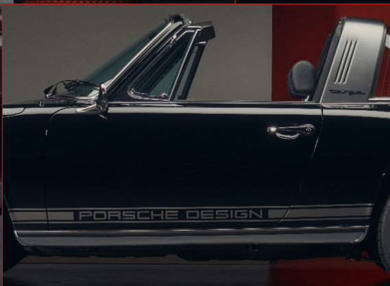
Dekorfolierung "PORSCHE DESIGN" in Platinum (seidenglanz)

Schriftzug "Porsche" und „911 S“ auf dem Heck in matt Schwarz