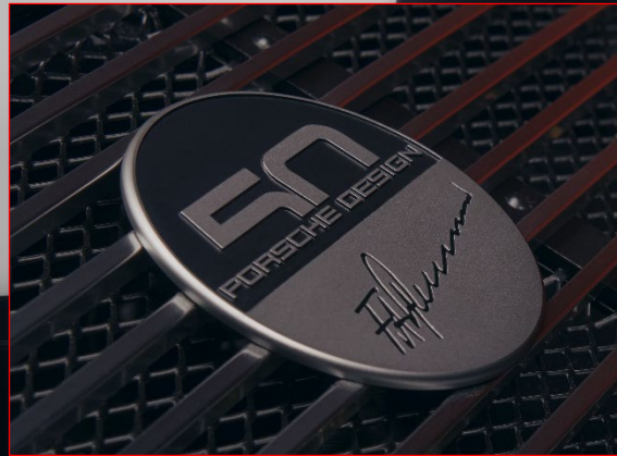
"50 Jahre Porsche Design" Plakette mit Facsimile Unterschrift von F.A. Porsche auf den Lamellen im Heckdeckelgitter

Schriftzug "Porsche" und „911 S“ auf dem Heck in matt Schwarz