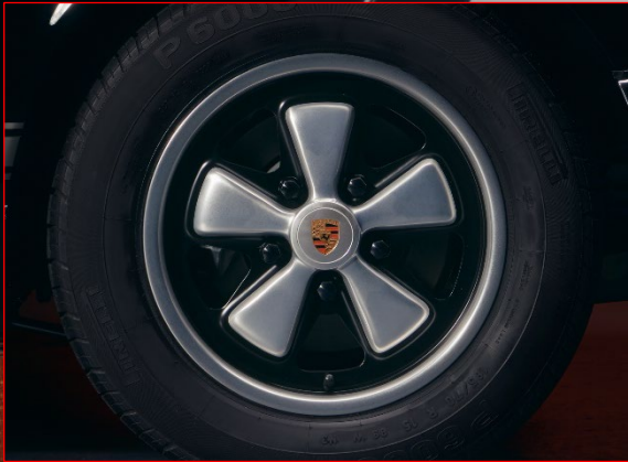
Eloxierte Fuchsfelgen mit Radzierdeckeln mit farbigem Porsche Wappen